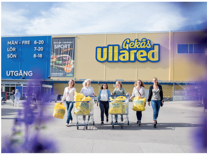
Gekås varuhus i Ullared.