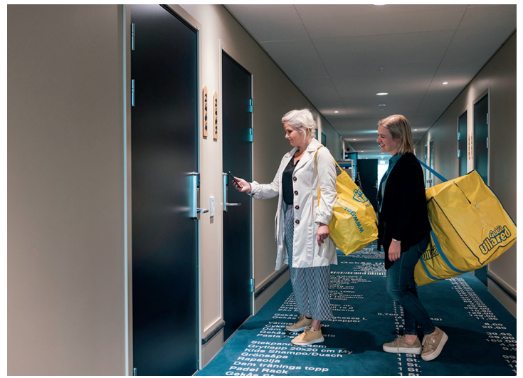
Hotellet i Ullared.